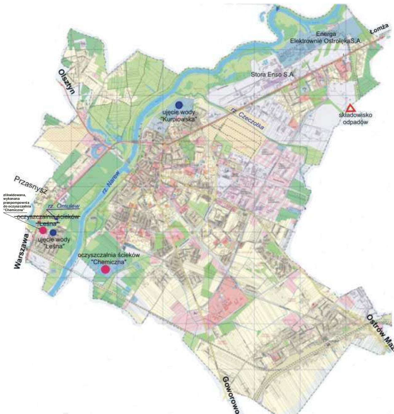
Lokalizacja głównych obiektów inżynierii technicznej miasta Ostrołęki