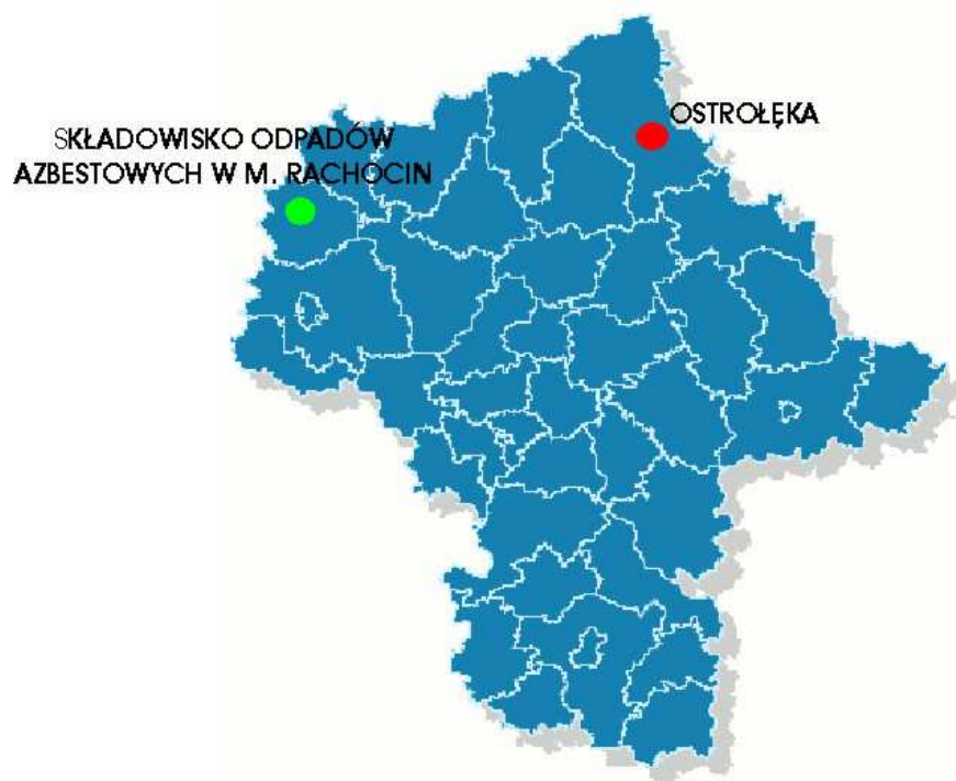
Rys. Nr 1. Składowiska odpadów azbestowych w województwie mazowieckim.